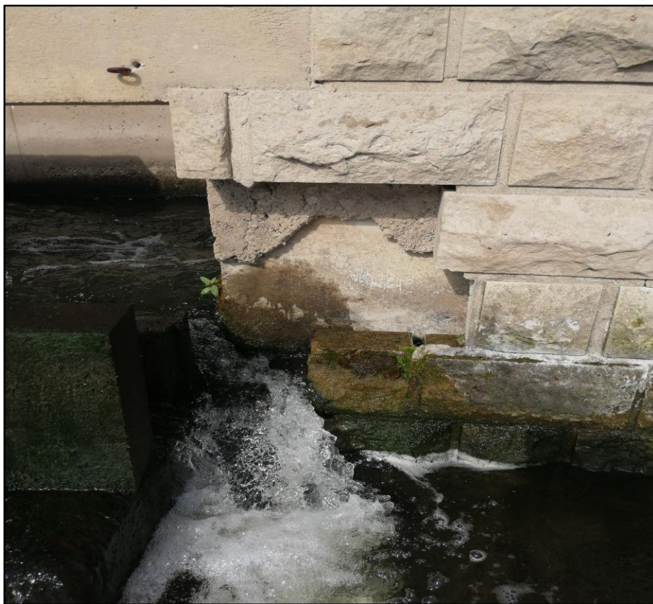
Foto č. 2 – Poškozený pískovcový obklad tělesa rybího přechodu na VD Terezín